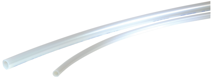
Abbildungen können von tatsächlich gelieferten Geräten abweichen